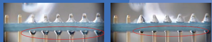
Almit DB-1 RMA LFM-48M