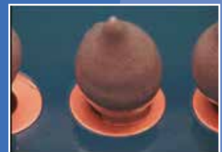
vor dem Löten / before soldering