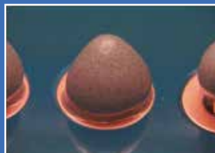
vor dem Löten / before soldering