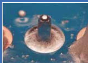
nach dem Löten / after soldering