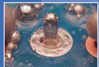
nach dem Löten / after soldering

Für mehr Informationen sprechen Sie bitte mit Ihrem Almit-Fachberater. / For further information please speak to your specialist Almit adviser.