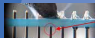
herkömmlicher Lötendraht conventional solder wire