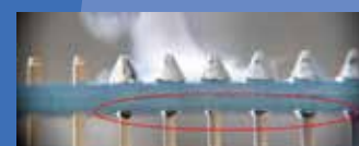
herkömmlicher Lötendraht conventional solder wire