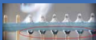
Almit DB-1 RMA LFM-48 M