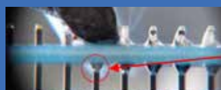
Almit DB-1 RMA LFM-48 M