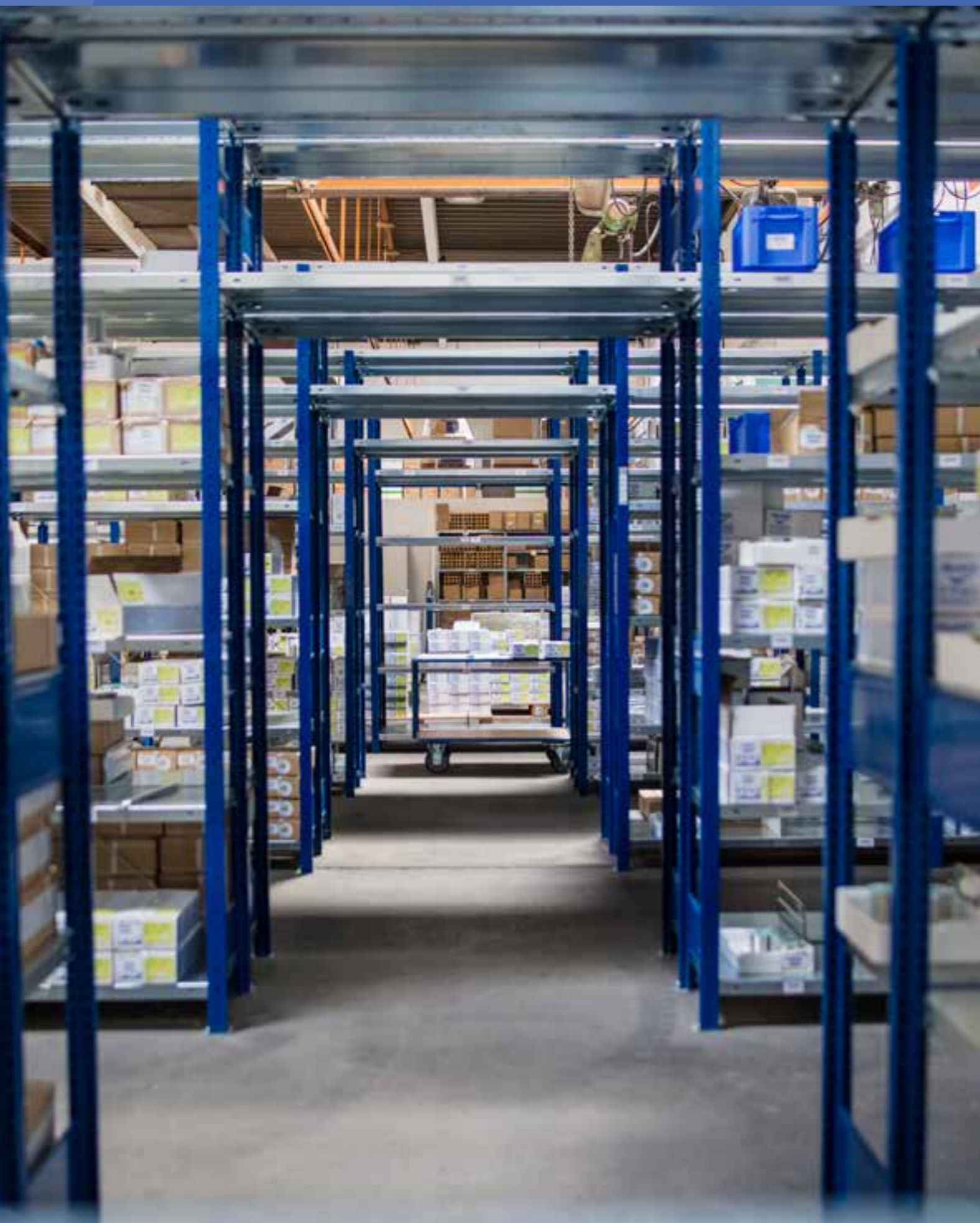
Zentrallager für Europa in Michelstadt, Deutschland Central warehouse for Europe at Michelstadt, Germany