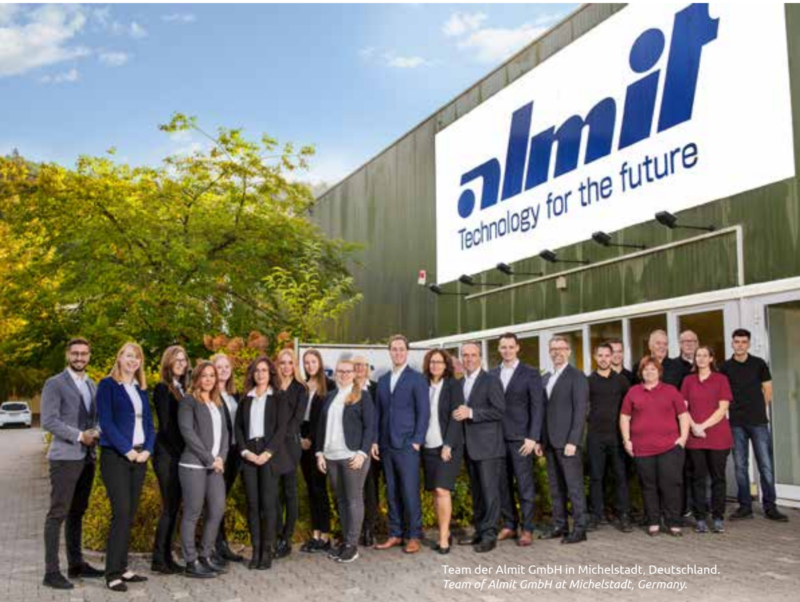
Team der Almit GmbH in Michelstadt, Deutschland. Team of Almit GmbH at Michelstadt, Germany.