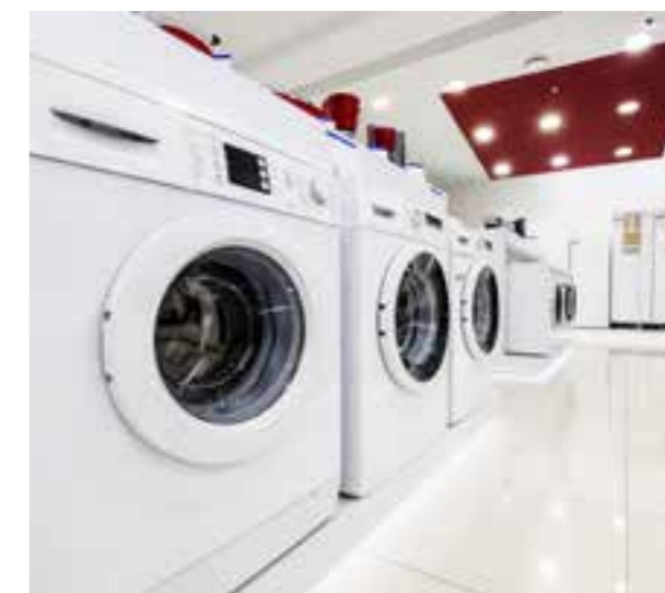
Haushaltsgeräte / Household appliances