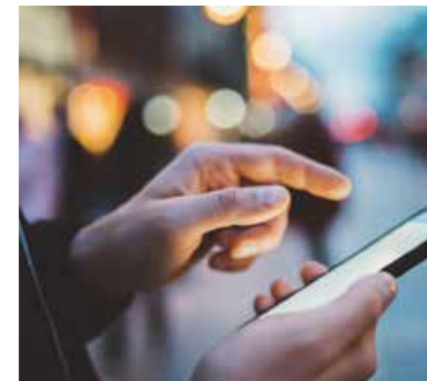
Telekommunikation / Telecommunication