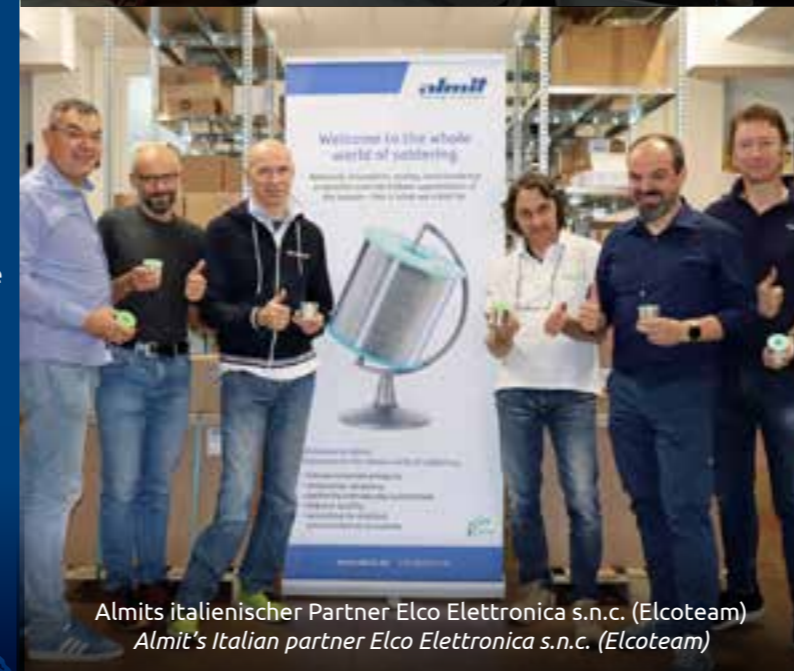
Almits italienischer Partner Elco Elettronica s.n.c. (Elcoteam) Almit's Italian partner Elco Elettronica s.n.c. (Elcoteam)