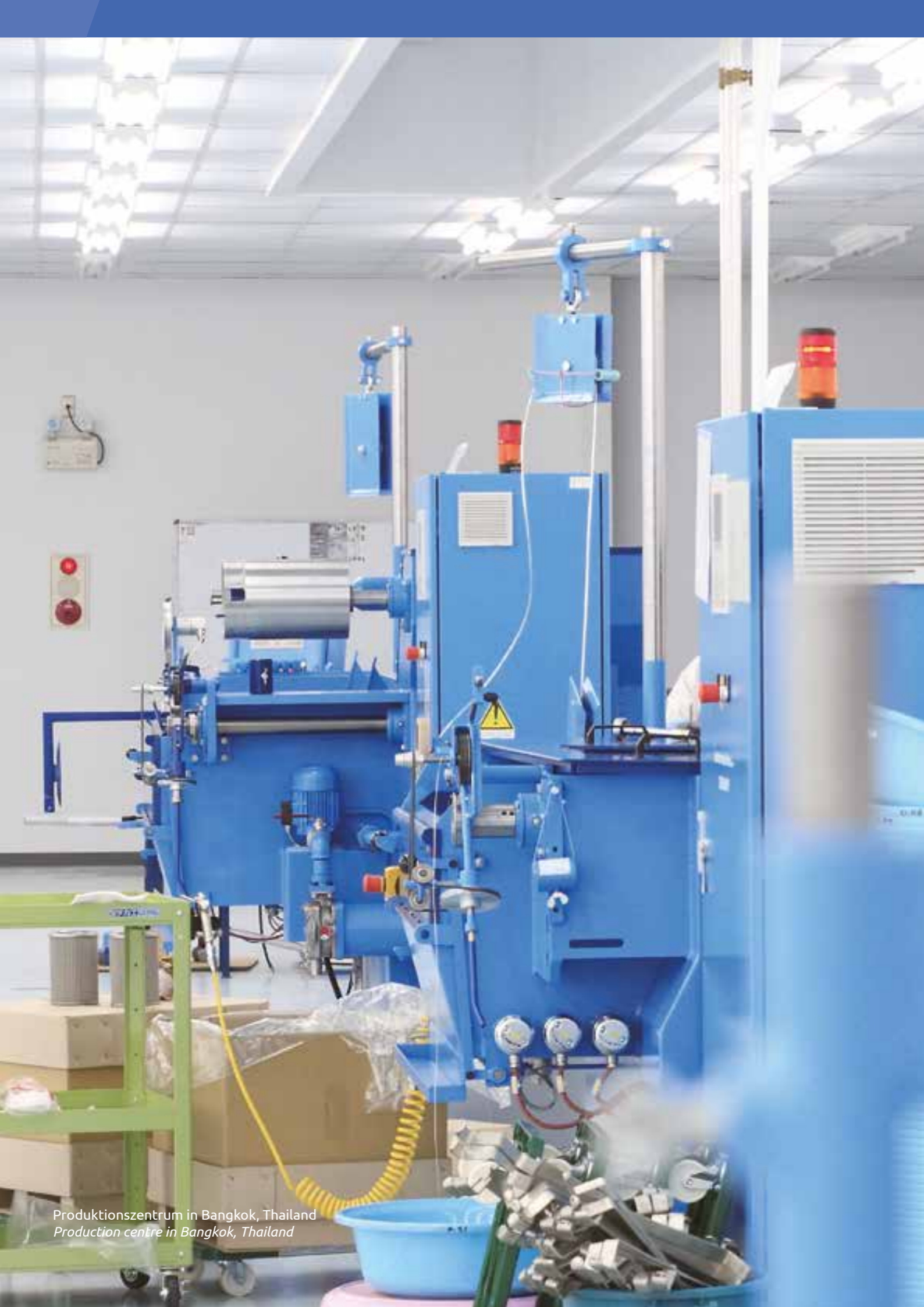
Produktionszentrum in Bangkok, Thailand Production centre in Bangkok, Thailand