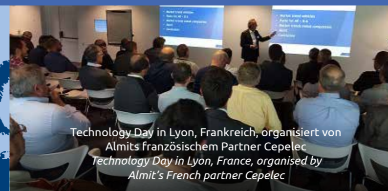
Technology Day in Lyon, Frankreich, organisiert von Almits französischem Partner Cepelec Technology Day in Lyon, France, organised by Almit's French partner Cepelec