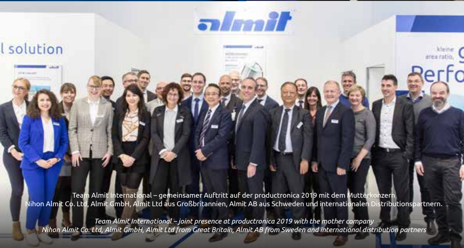
Team Almit International – gemeinsamer Auftritt auf der productronica 2019 mit dem Mutterkonzern Nihon Almit Co. Ltd, Almit GmbH, Almit Ltd aus Großbritannien, Almit AB aus Schweden und internationalen Distributionspartnern.