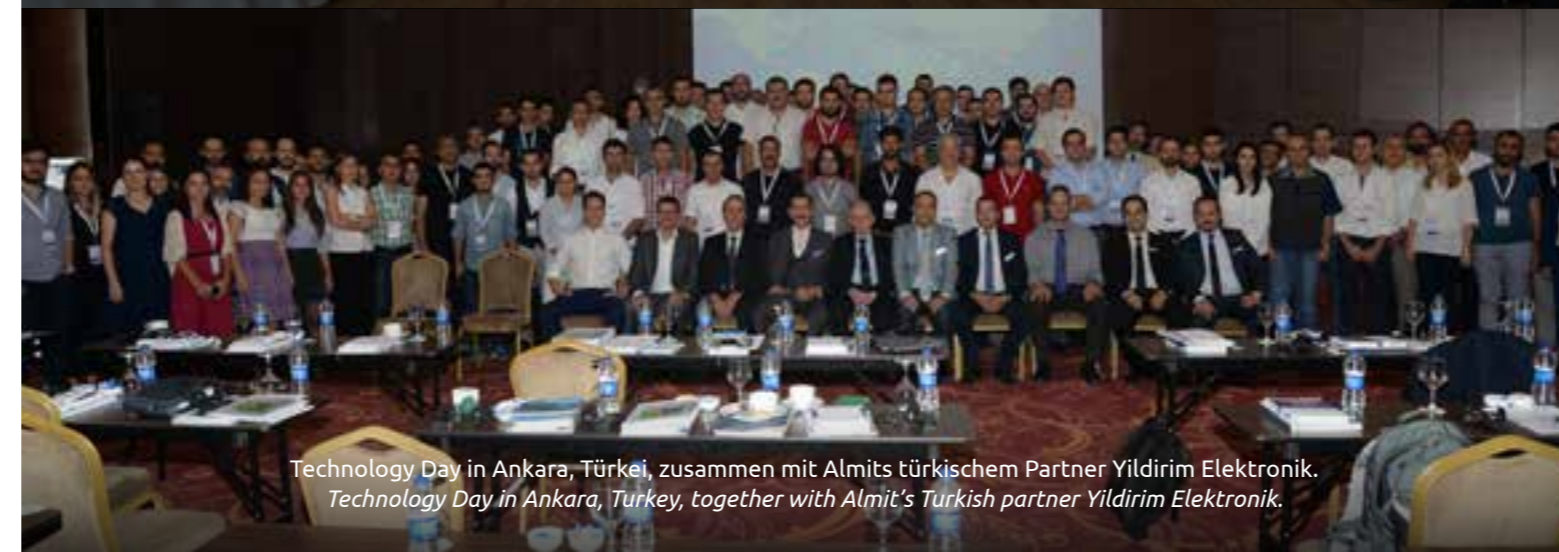
Technology Day in Ankara, Türkei, zusammen mit Almits türkischem Partner Yildirim Elektronik. Technology Day in Ankara, Turkey, together with Almit's Turkish partner Yildirim Elektronik.