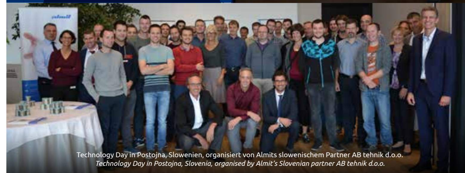
Technology Day in Postojna, Slowenien, organisiert von Almits slowenischem Partner AB tehnik d.o.o. Technology Day in Postojna, Slovenia, organised by Almit's Slovenian partner AB tehnik d.o.o.