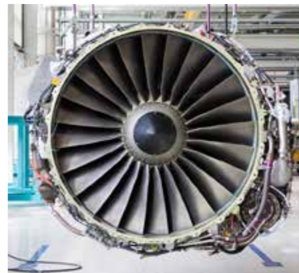
Luft- und Raumfahrt / Aerospace

Almit wants to continue to provide our customers at any time with individual, perfect solutions which meet their requirements and needs in the future. With excellent quality, the optimum cost-benefit ratio and the best possible protection of the environment and people. This aspiration has won over thousands of companies worldwide from many different industries.