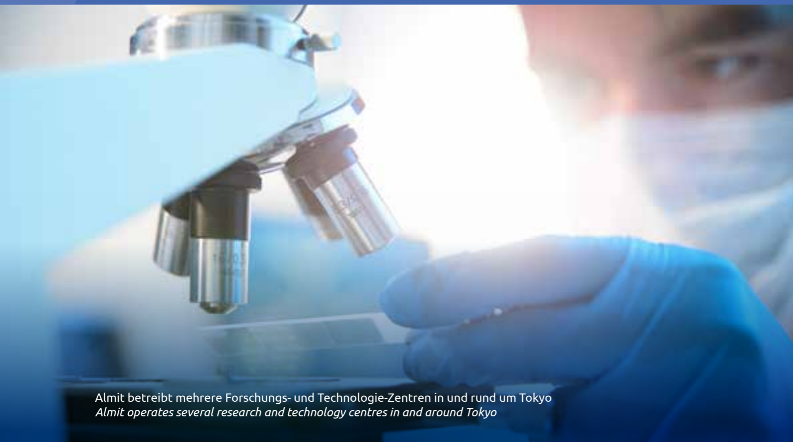
Almit betreibt mehrere Forschungs- und Technologie-Zentren in und rund um Tokyo Almit operates several research and technology centres in and around Tokyo