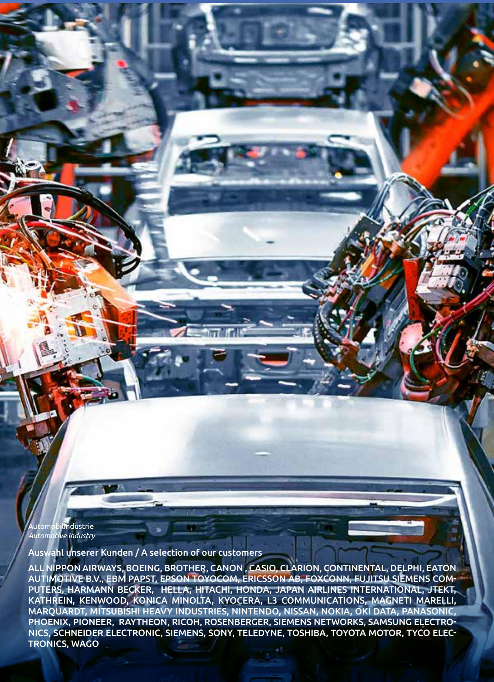
Automobilindustrie Automotive industry